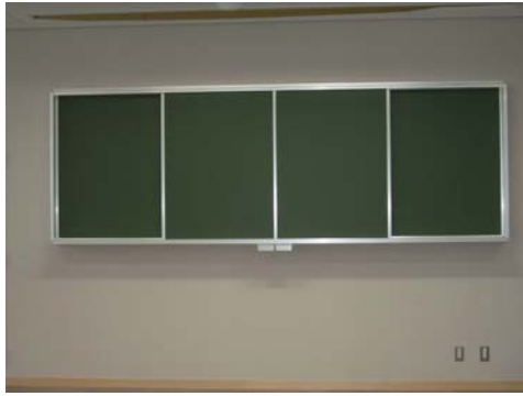
アルミ枠引分式黒板(後ろ面:ホワイトボード)