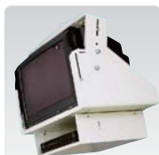
既設天吊ブラウン管テレビ