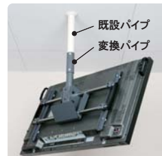
天吊り薄型テレビ