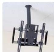
天吊薄型ディスプレイハンガー